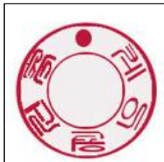
○ (직인형태만 업로드)