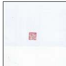
X (직인 외 불필요한 공간 삭제)