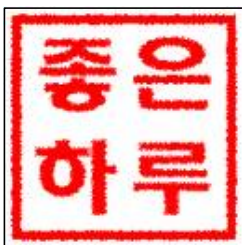
○ (직인형태만 업로드)